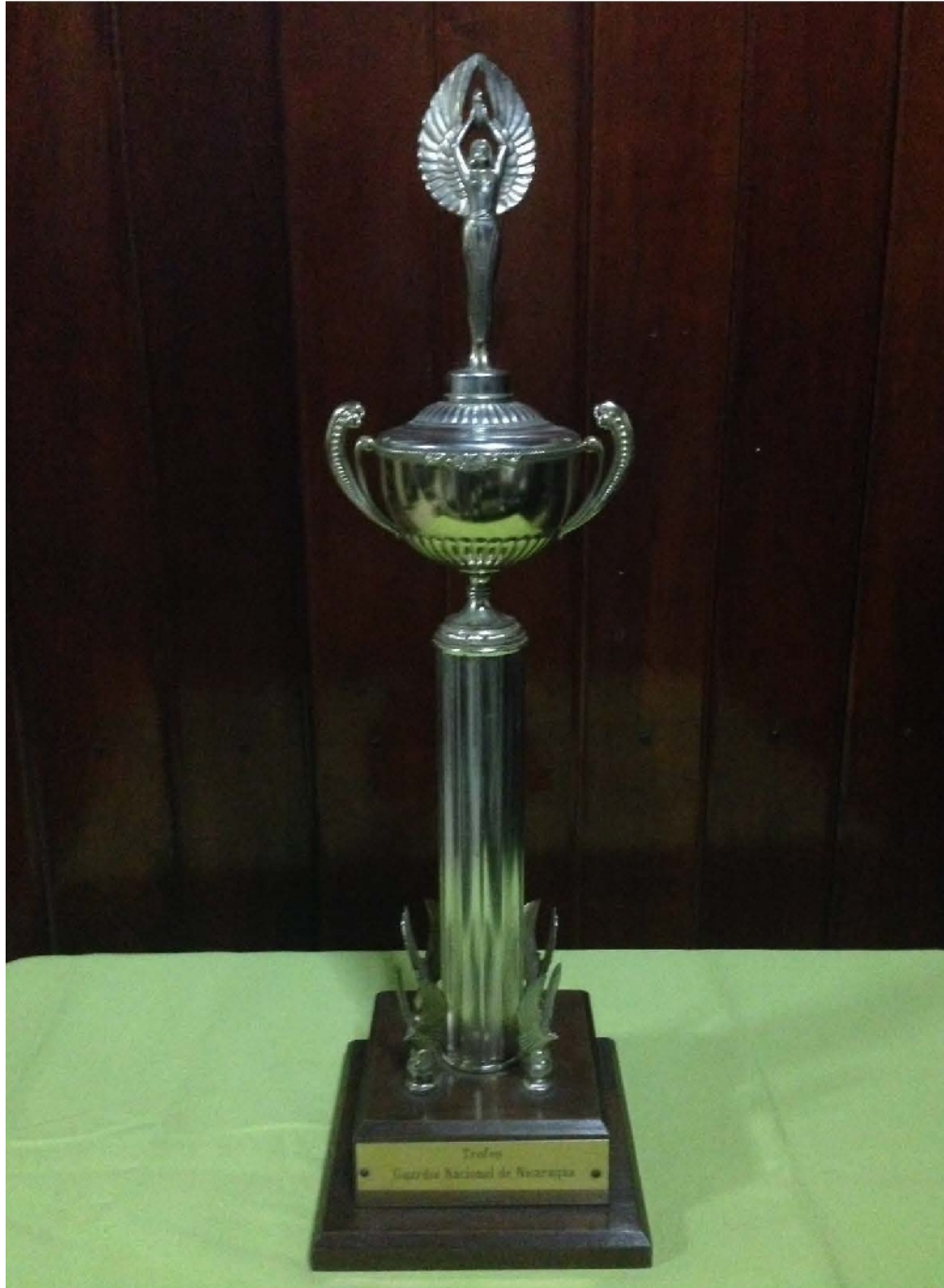
Trofeo campeón nacional de Nicaragua, 1968.