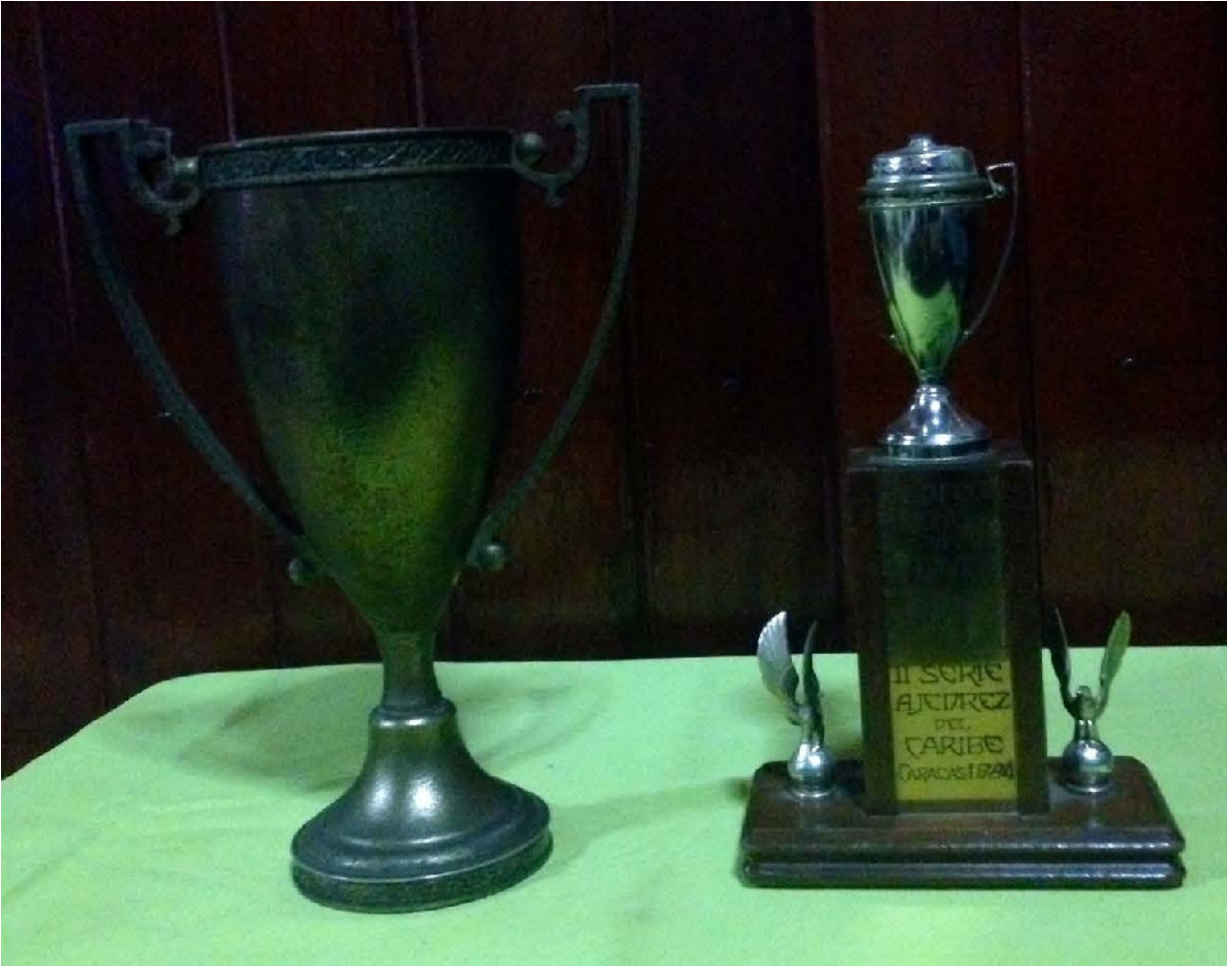
II Serie Ajedrez del Caribe. Caracas 1984.