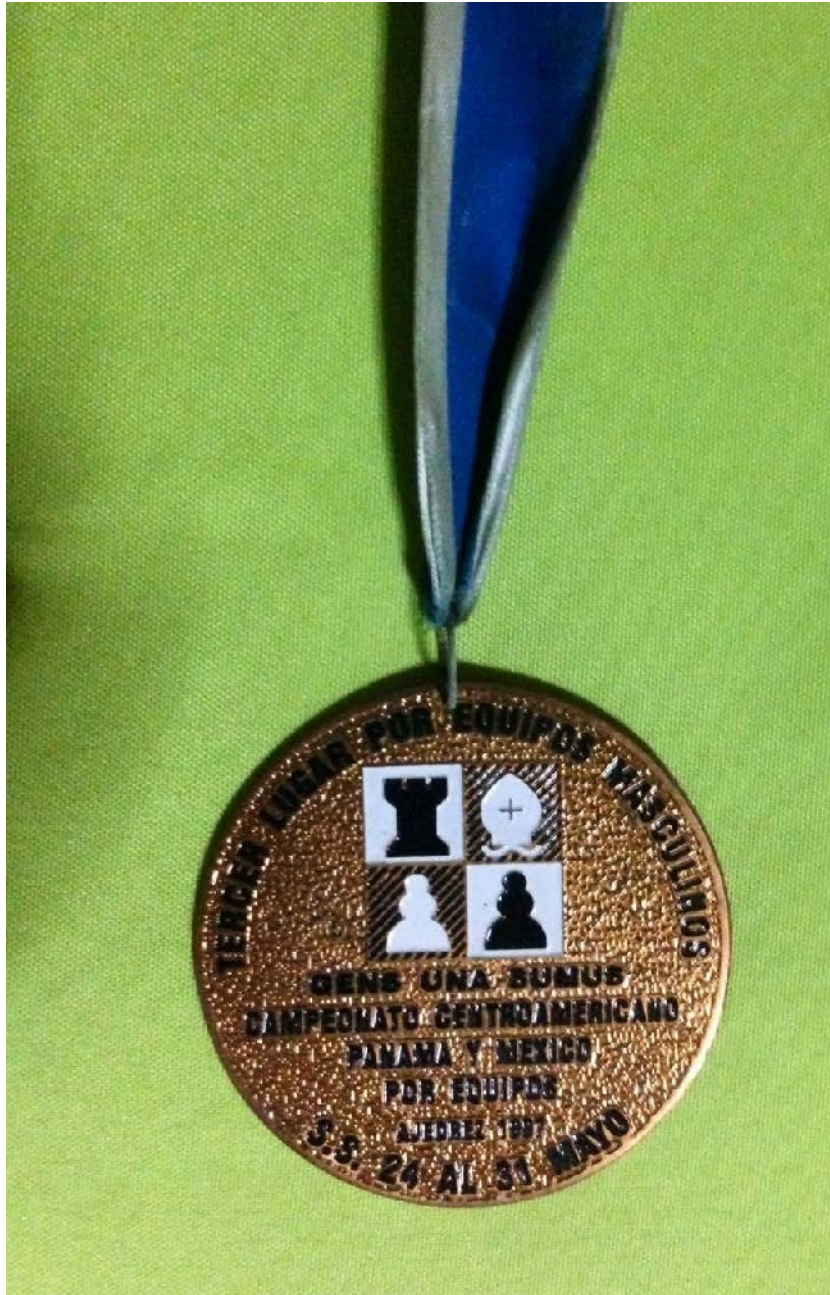
Tercer Lugar por equipos Masculinos. Campeonato Centroamericano Panamá y México por equipos. 1997.