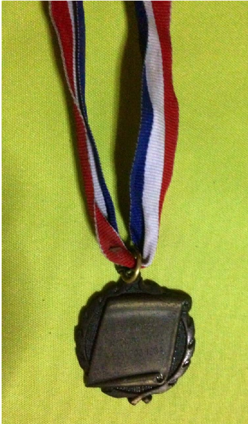
Campeón de El Caribe. San Juan Puerto Rico, 1963.