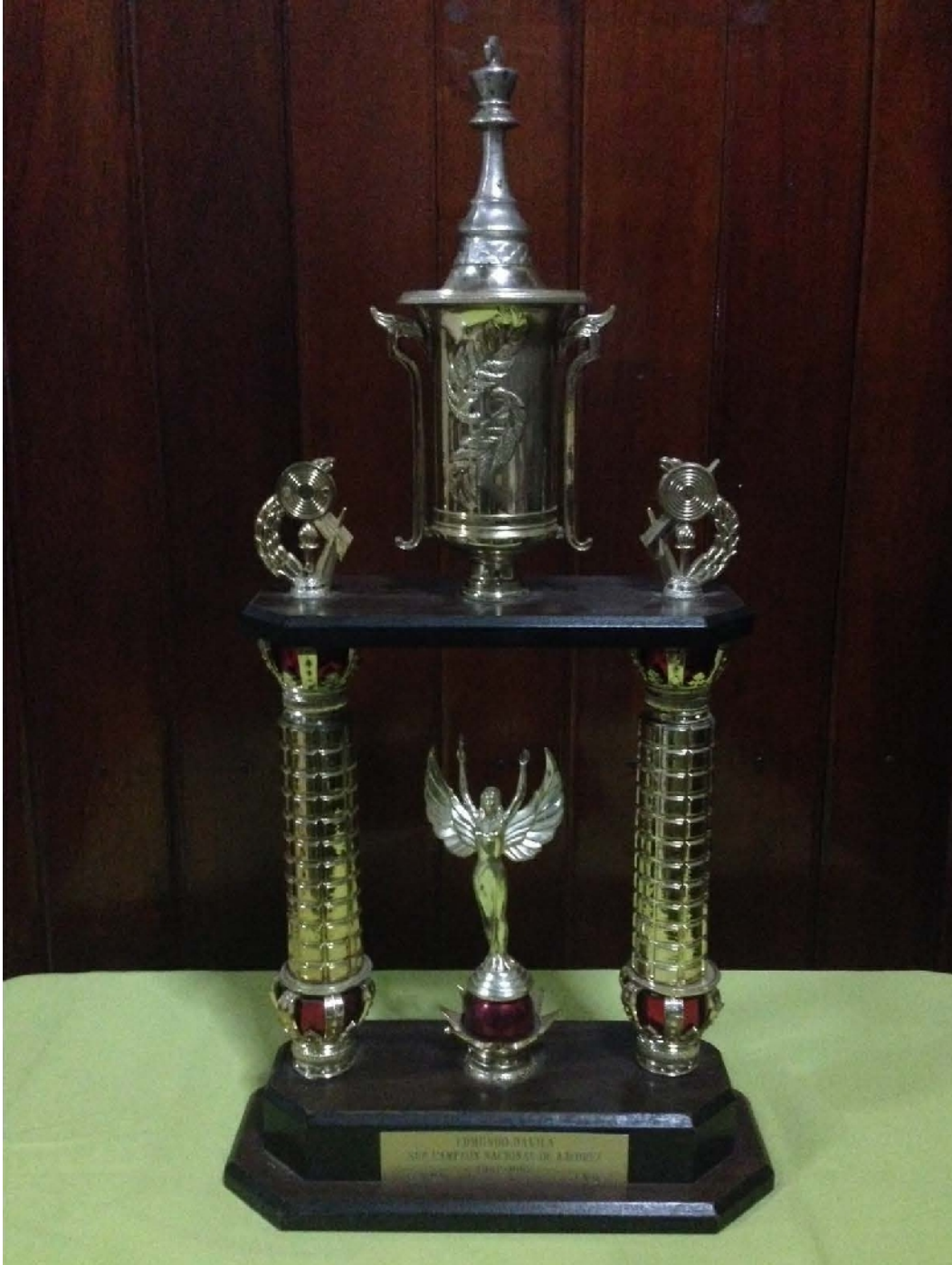
Subcampeón nacional de ajedrez.