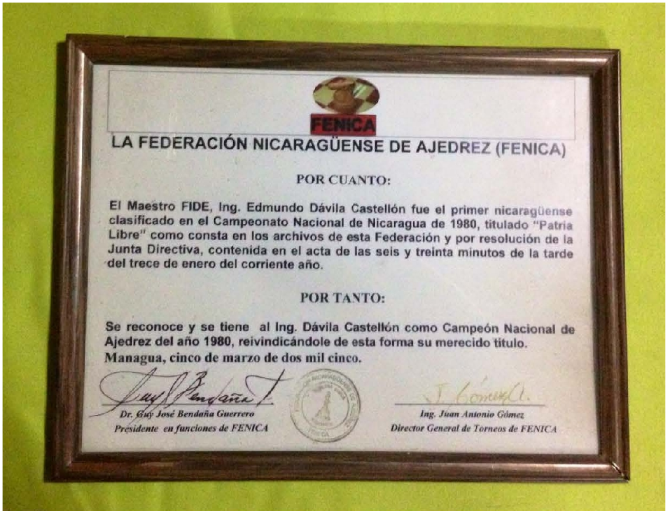
Diploma de la Federación Nicaragüense de Ajedrez (FENICA) que lo reconoce como Campeón Nacional de ajedrez del año 1980. 5 de marzo de 2005.