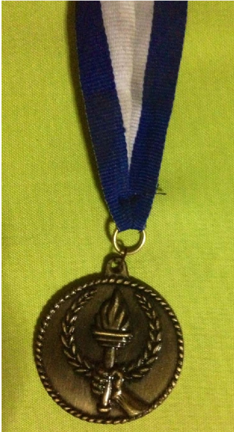
Campeón de Centroamérica. Guatemala 1956.