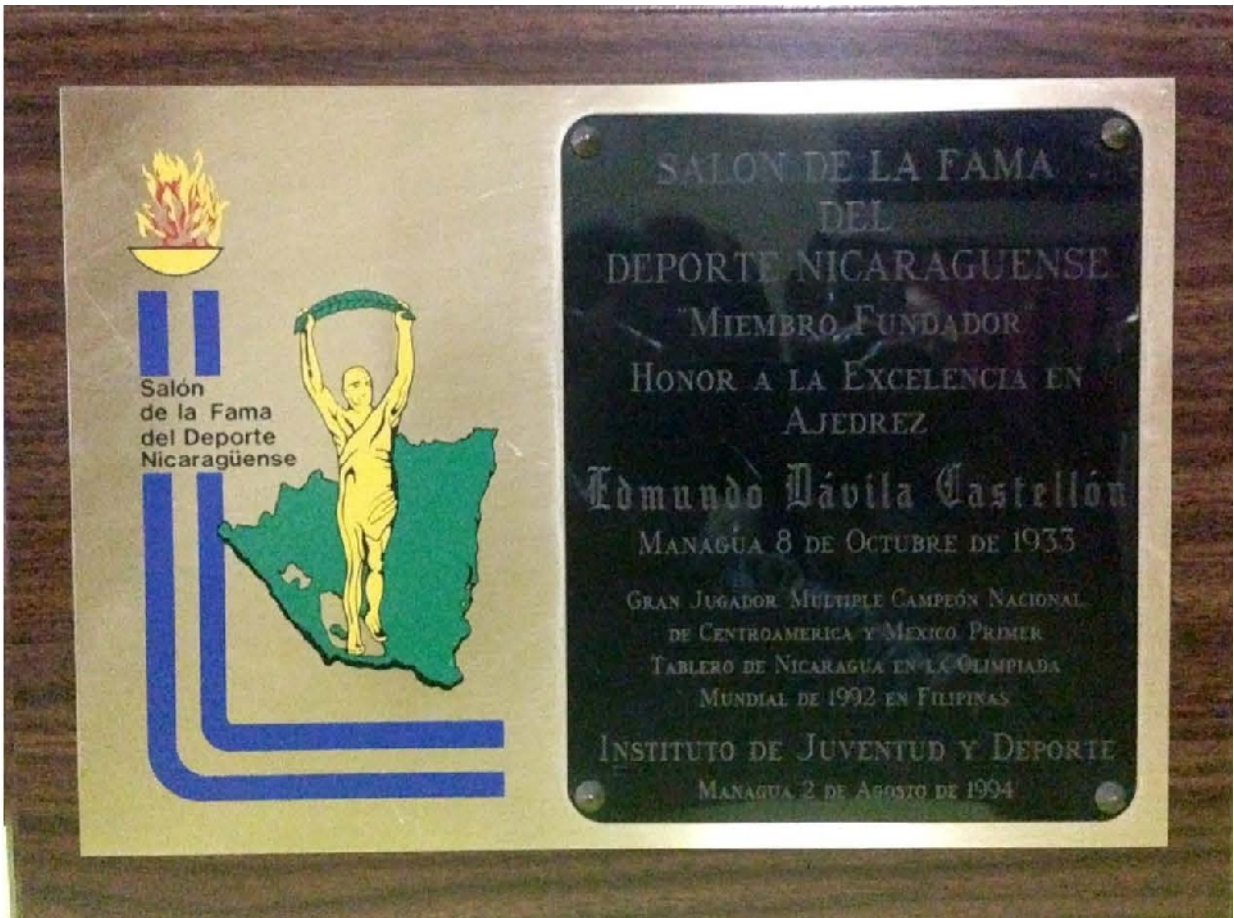
Placa que lo acredita como “Miembro Fundador” Honor a la excelencia en Ajedrez, del Salón de la Fama del Deporte Nicaragüense. Gran jugador, múltiple campeón nacional de Centroamérica y México, primer tablero de Nicaragua en la Olimpiada Mundial de 1992 en Filipinas. Otorgada por el Instituto de Juventud y Deporte, el 2 de Agosto de 1994.