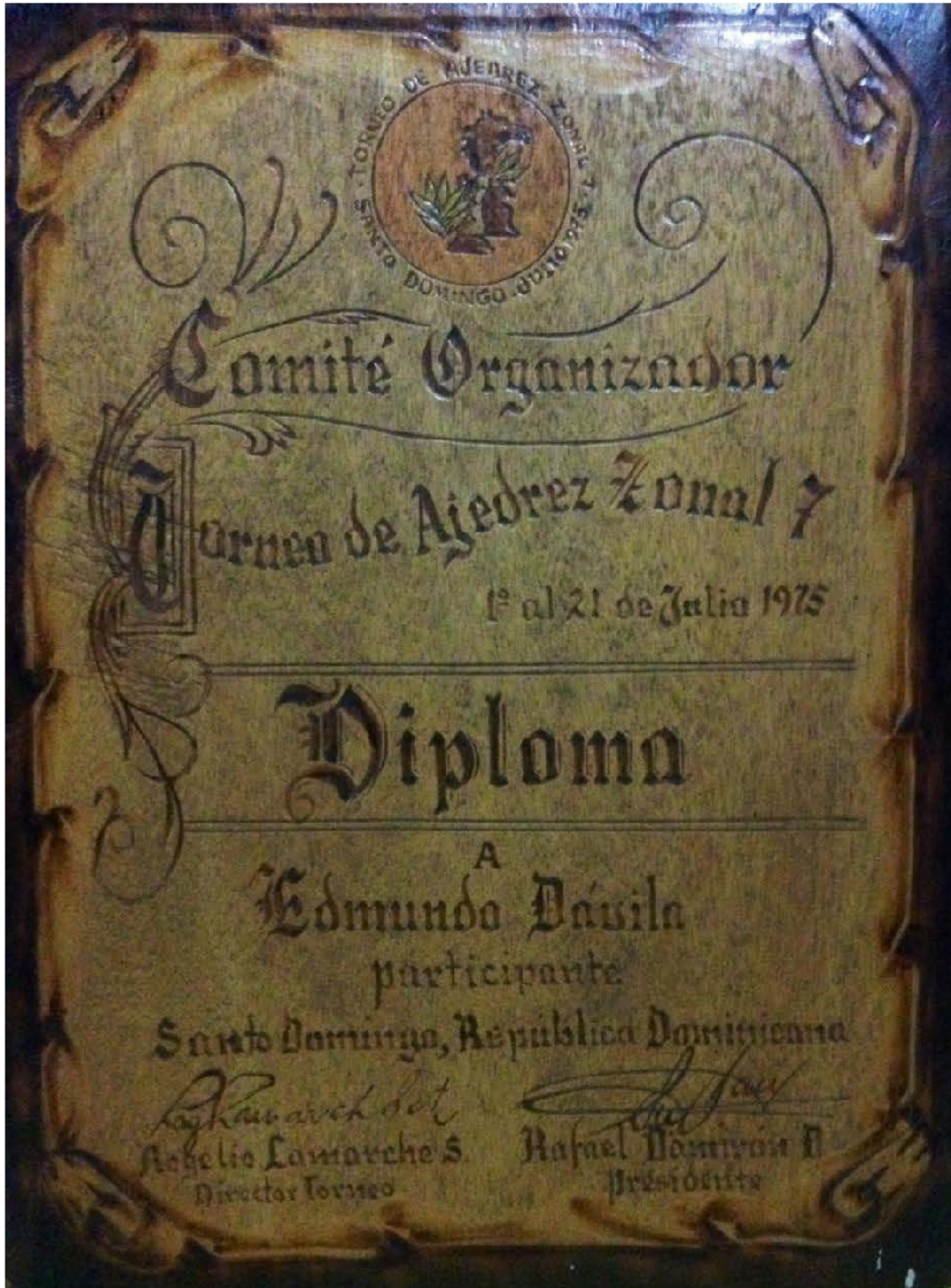
Torneo de Ajedrez Zonal 7. Santo Domingo, República Dominicana. Julio 1975.