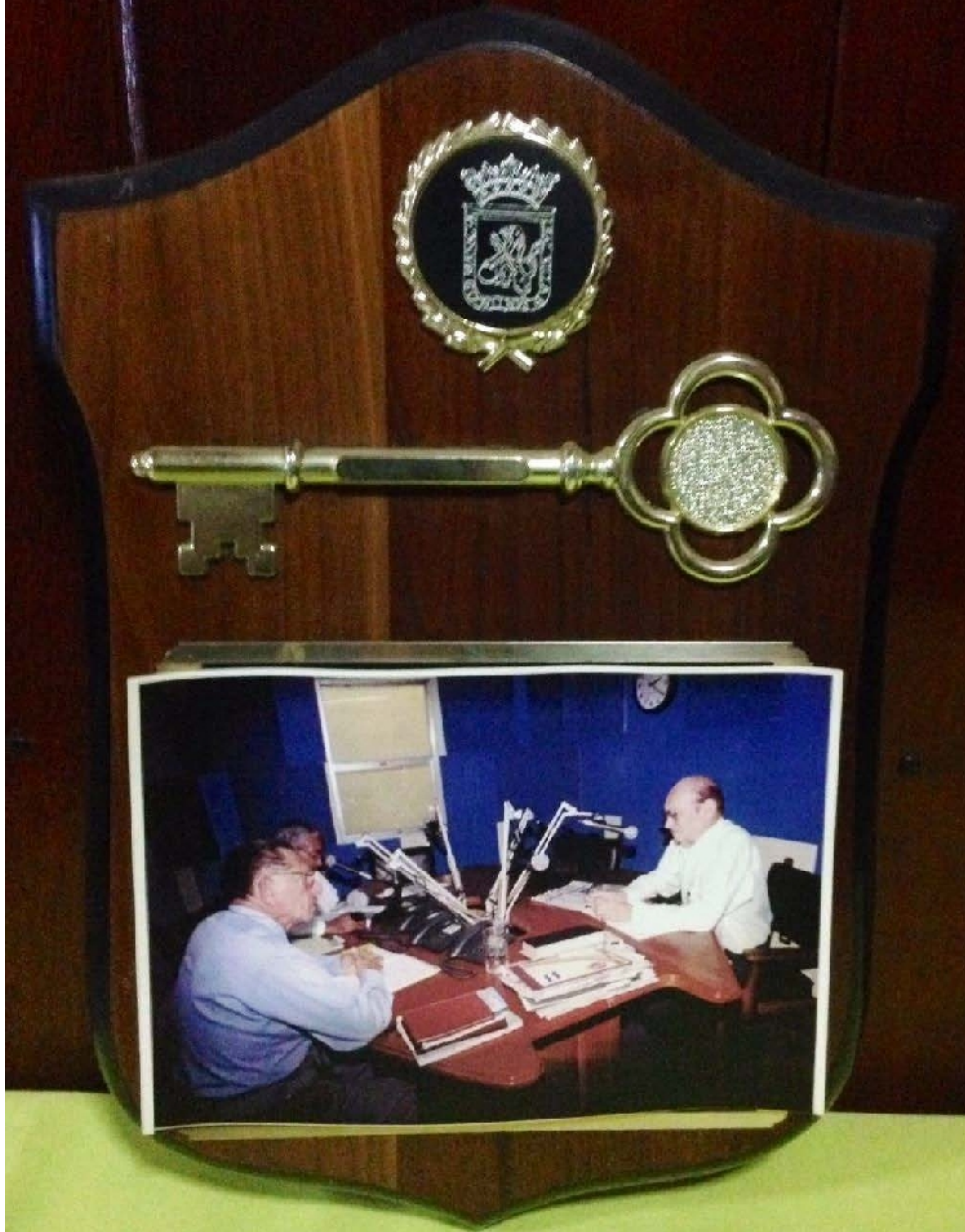
Llaves de la ciudad de Managua.