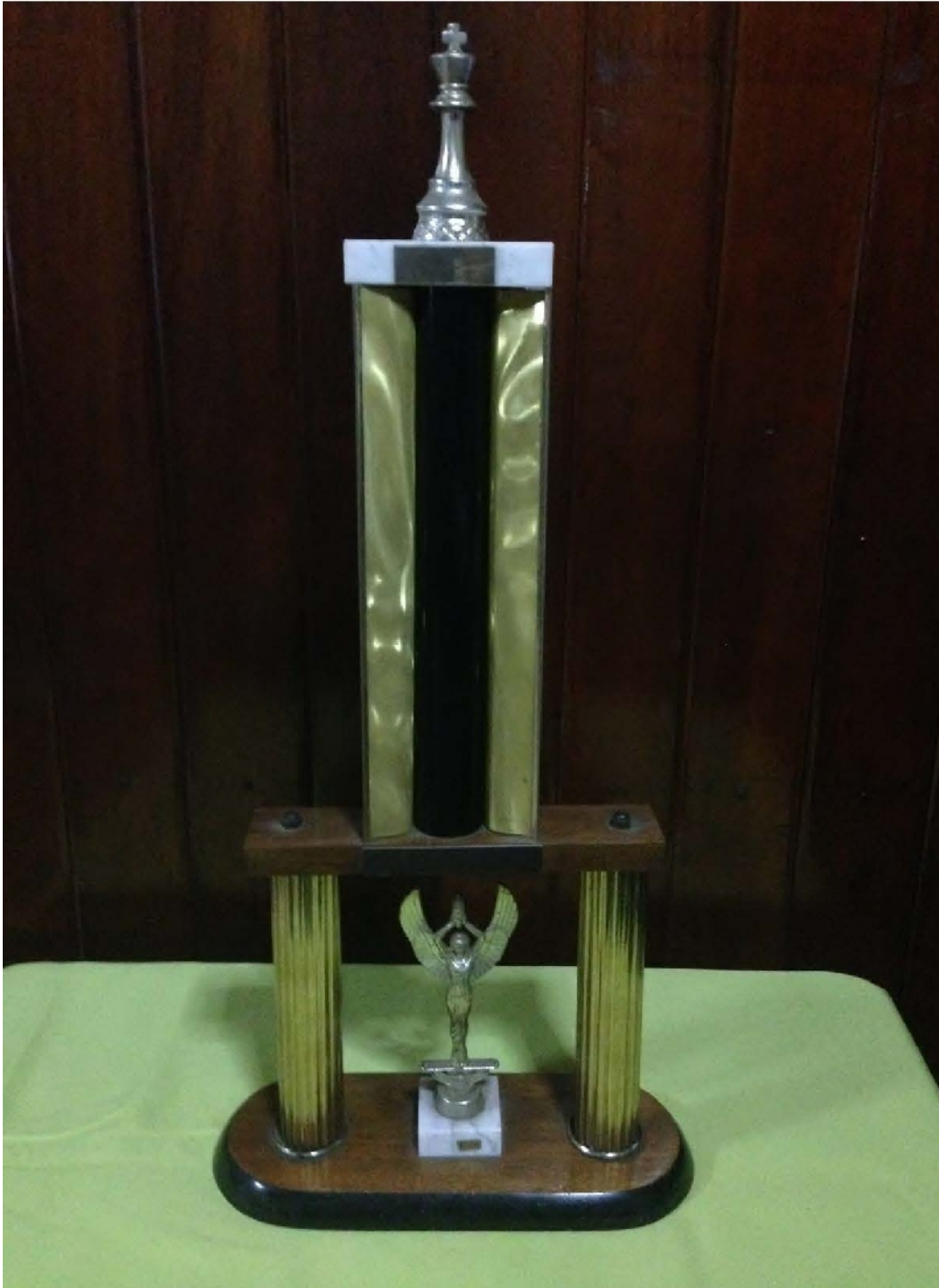
Campeón de Centroamérica y El Caribe. Managua, Nicaragua, 1965